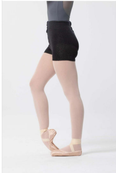
Modelo1 : 5053 (OPCIONAL)