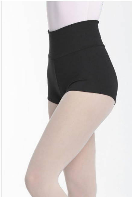
Modelo 2: 5263 (OPCIONAL)